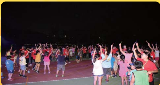
港區小天使活動照片